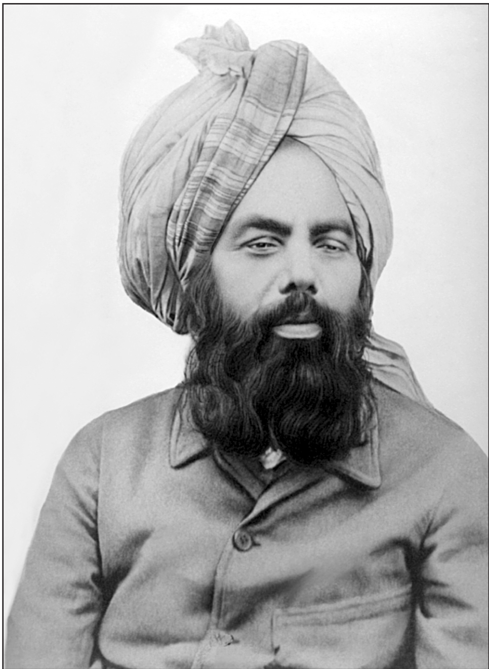
حضرت مرزا غلام احمد دینانی سیح موعود و مهدی موعود علیہ السلام